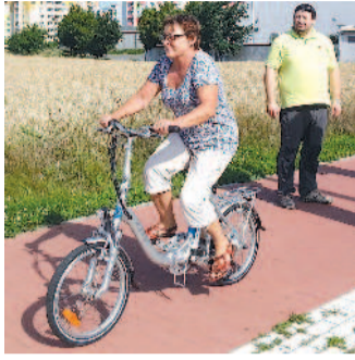
ELEKTROKOLO. Senioři si mohou o prázdninách zdarma vyzkoušet jízdu na elektrokole.

Olomouc – Jízdu na in-line bruslích, elektrokole či lezení v lanovém centru si mohou o prázdninách zdarma vyzkoušet senioři z Olomoucka. Akce nazvaná Senioři bez hranic se koná už pátým rokem. „I v srpnu jsme pro seniory připravili opět pestrý program složený